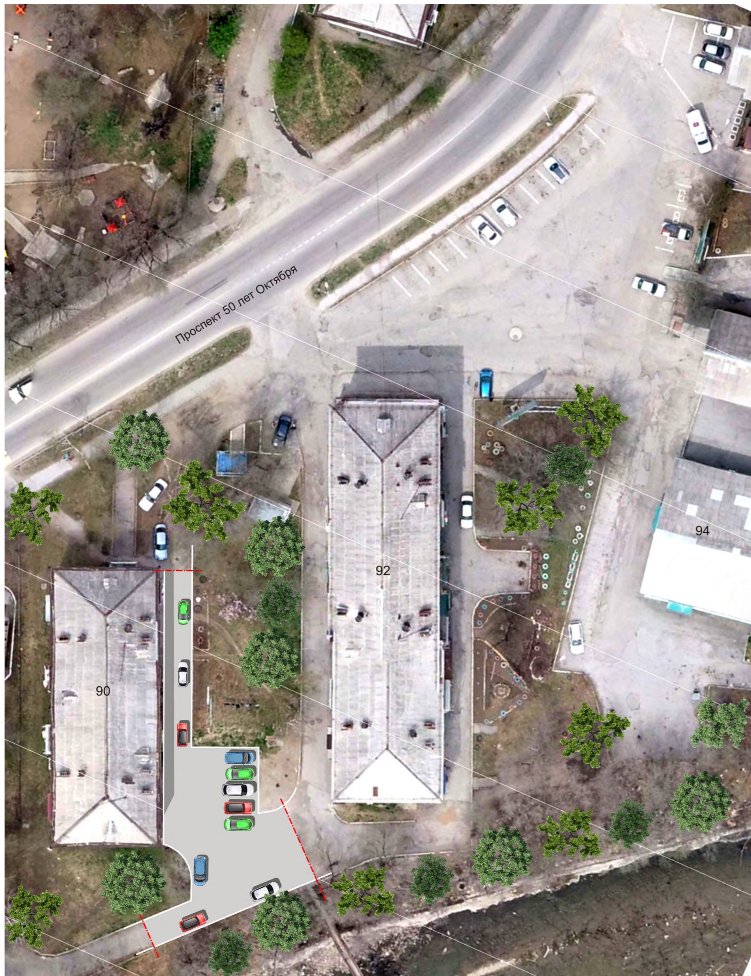
Проектное решение благоустройства придомовой территории.