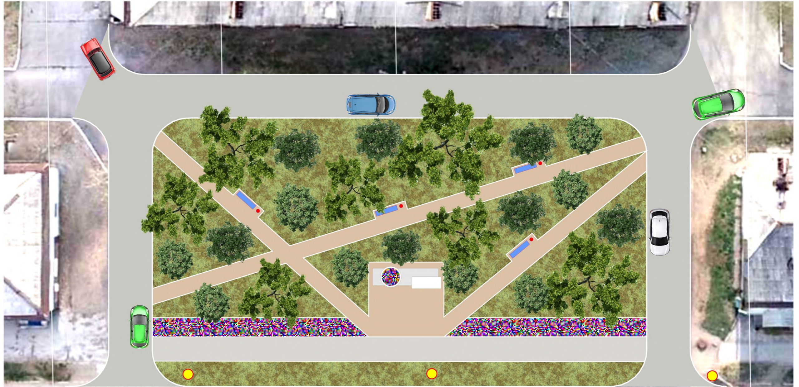
Существующее состояние территории сквера.