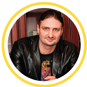
Эдгард ЗАПАШНЫЙ Народный артист России, генеральный директор Большого Московского государственного цирка на проспекте Вернадского