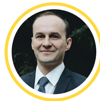
Сергей РЯЗАНСКИЙ Руководитель общероссийской общественно-государственной детско-юношеской организации «Российское движение школьников», герой Российской Федерации, летчик-космонавт