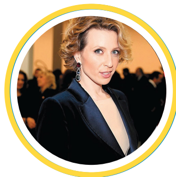
Яна ЧУРИКОВА Тележурналист, ведущая Первого канала, директор телеканала «MTV Россия»