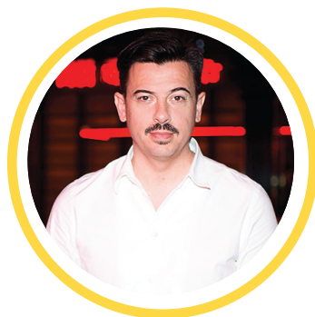
Денис СИМАЧЕВ Модельер, дизайнер, художник