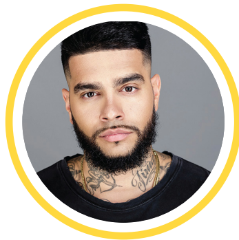
ТИМАТИ Певец, продюсер