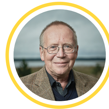
Юрий ВЯЗЕМСКИЙ Профессор МГИМО, автор и ведущий шоу «Умники и умницы»