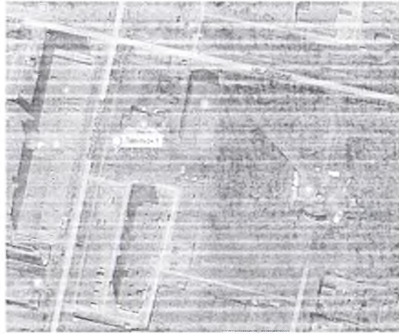
24. г.Верещагино, ул.Октябрьская, севернее дома №68