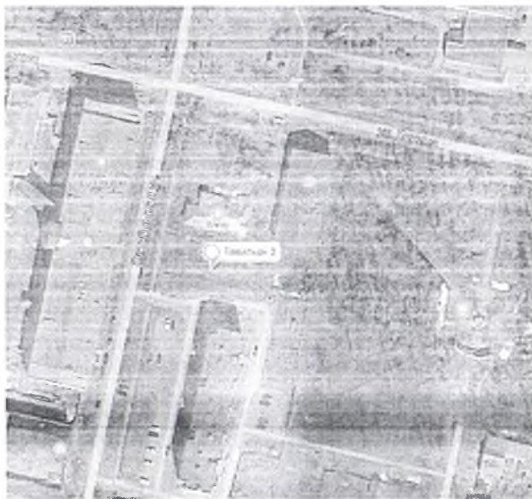
40. г.Верещагино, ул.Октябрьская, севернее дома №68