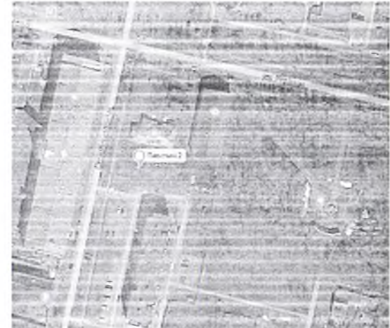
39. г.Верещагино, ул.Октябрьская, севернее дома №68