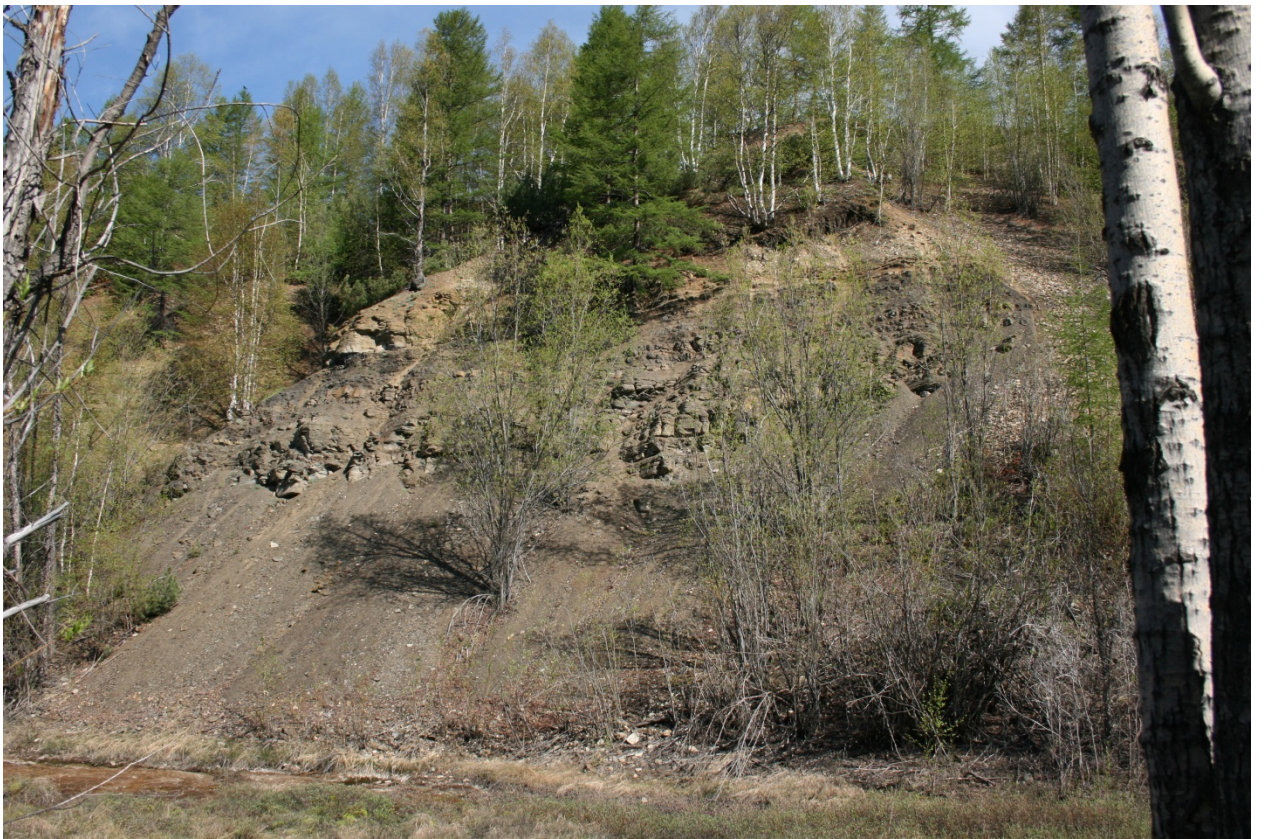
Фото 1-3. Памятник природы «Песчаный». Общий вид.