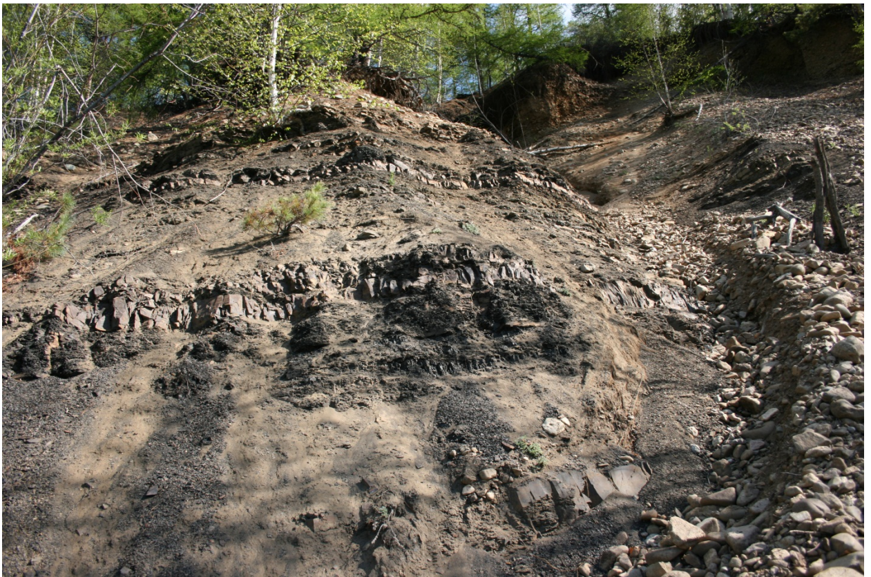
Фото 4-10. Наиболее характерные участки памятника природы «Песчаный».