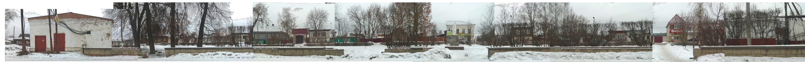
Развертка сквера им. А. С. Пушкина