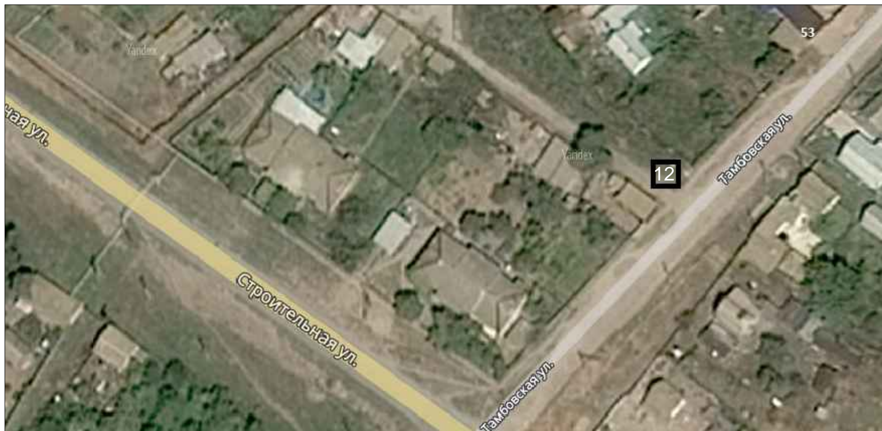
Схема расположения нестационарных торговых объектов с. Заплавное Заплавненского сельского поселения Ленинского муниципального района в М 1: 1000