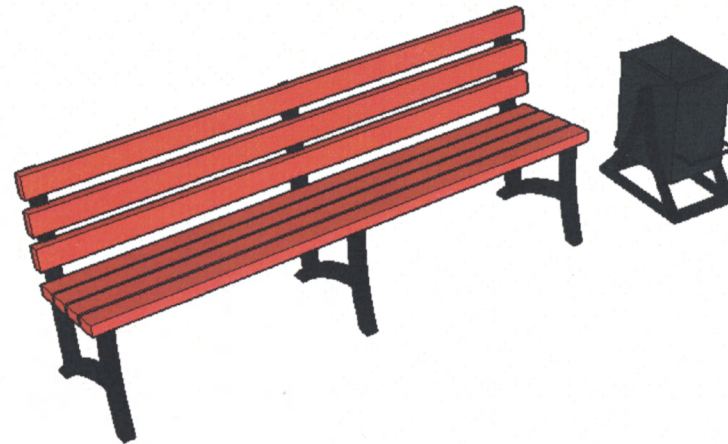
Урна и скамья