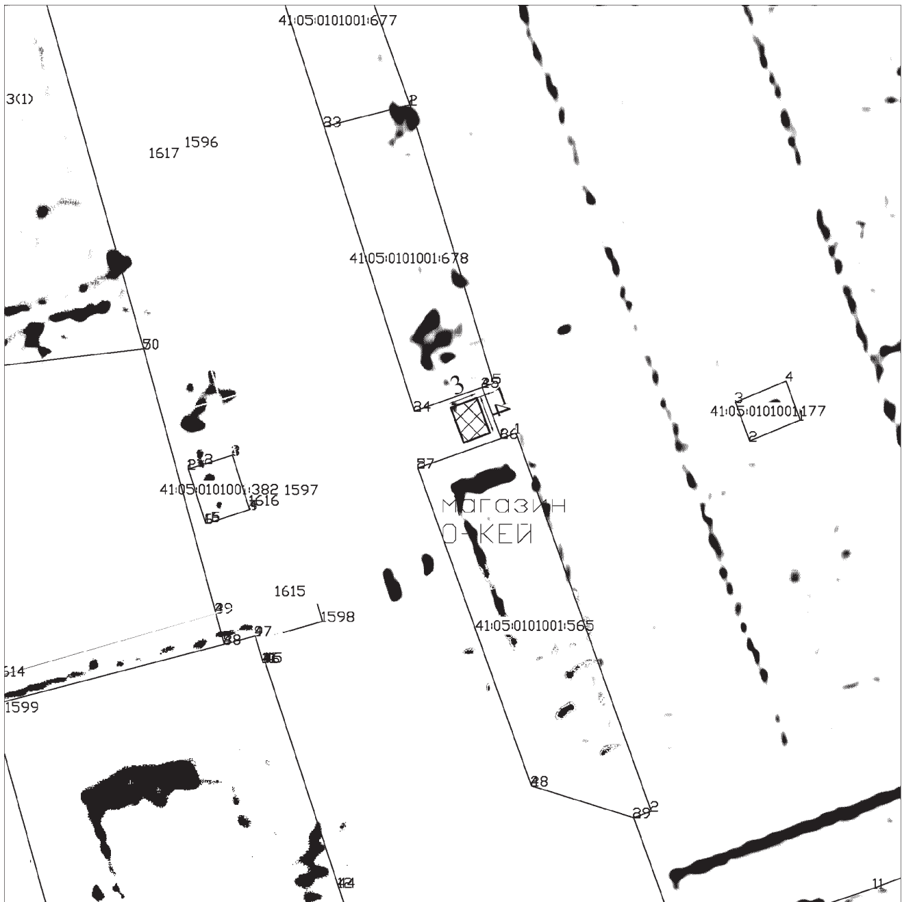
СХЕМА РАСПОЛОЖЕНИЯ площадки для размещения нестационарного торгового объекта на территории Елизовского городского поселения Местоположение: Камчатский край, р-н Елизовский, г. Елизово, микрорайон Северный, ул. Рябикова, район здания №56.

приложение I к извещению о проведении аукциона