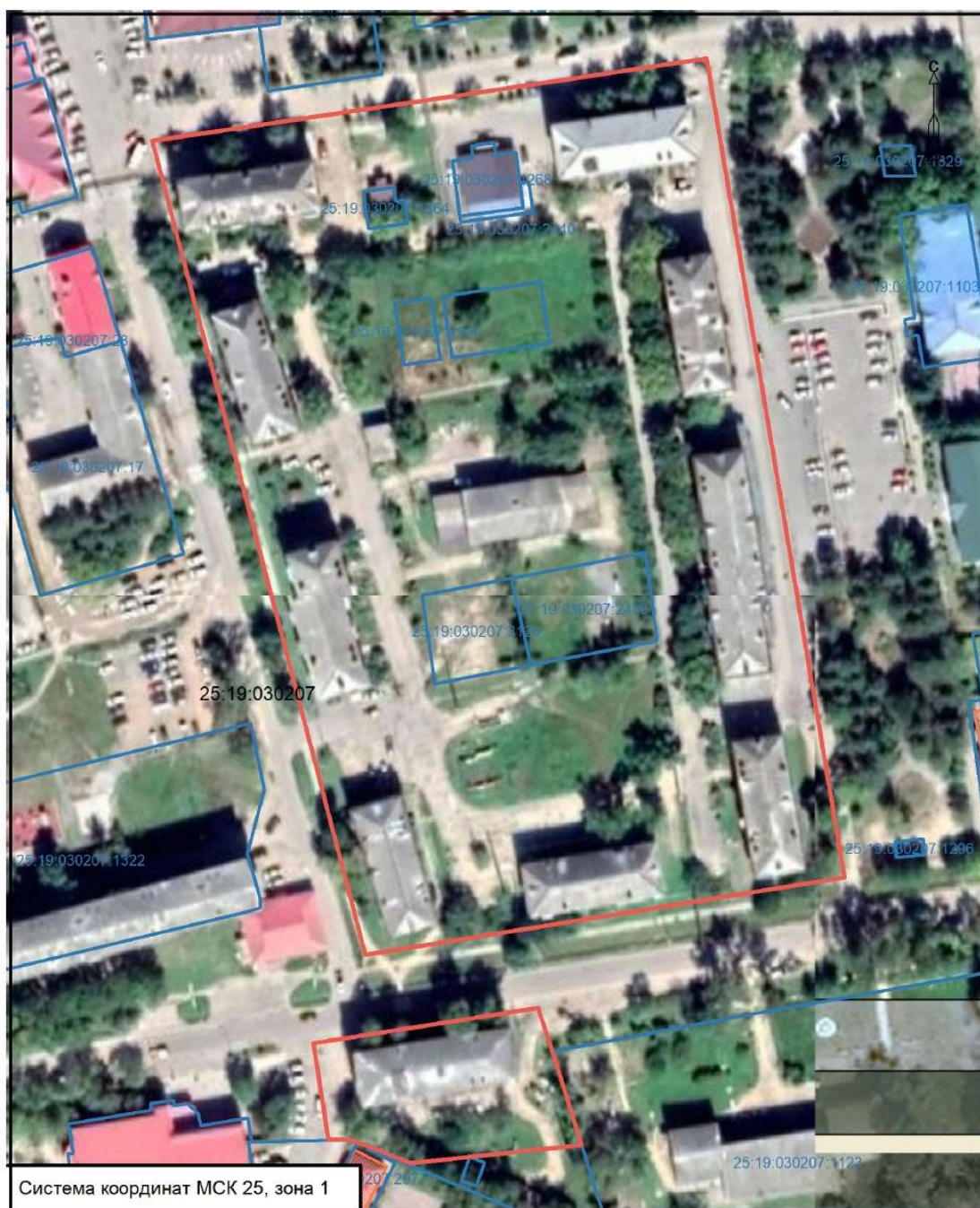
Схема размещения территории в структуре поселения