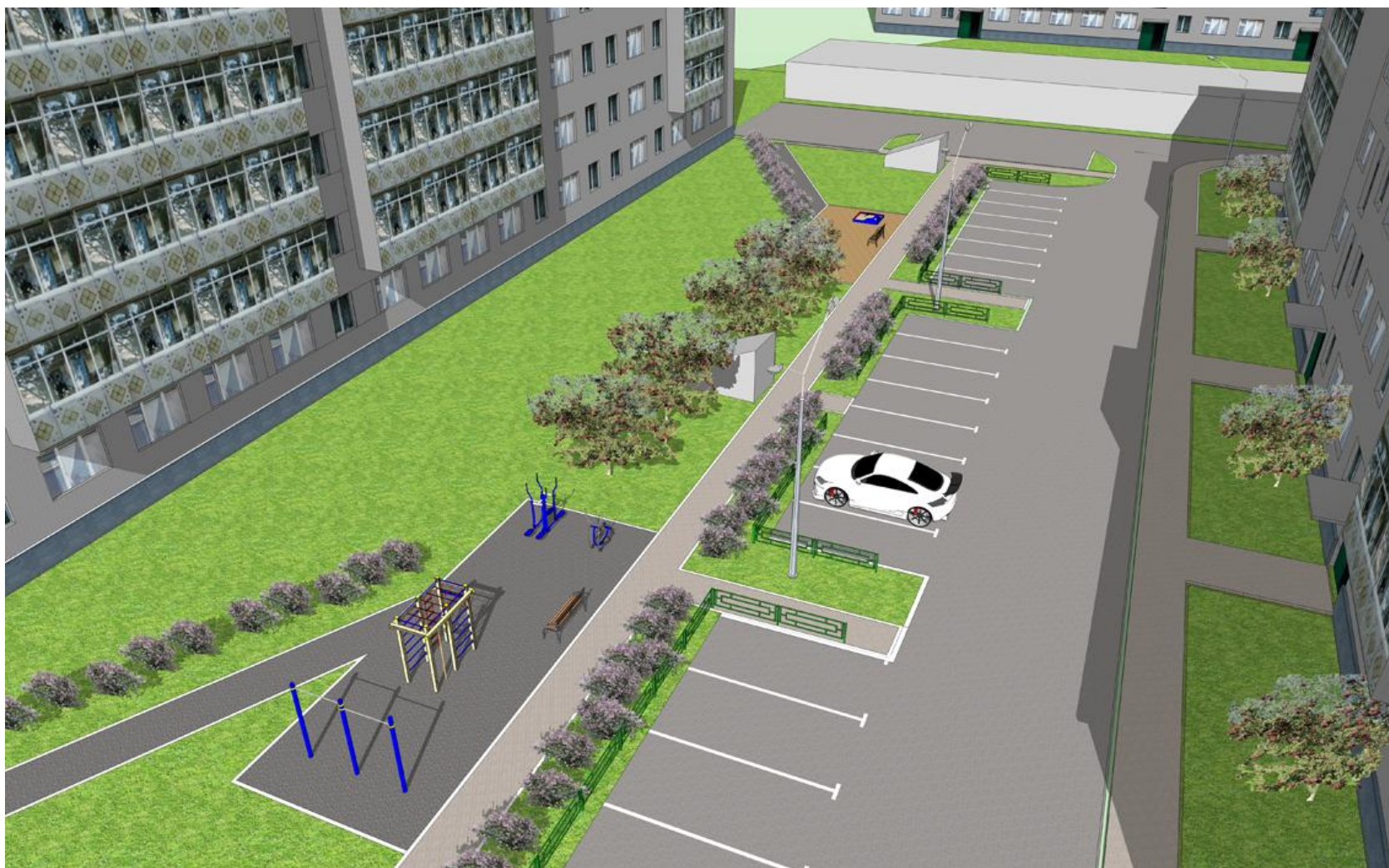
Перспективный вид на двор по ул. Юбилейная 5