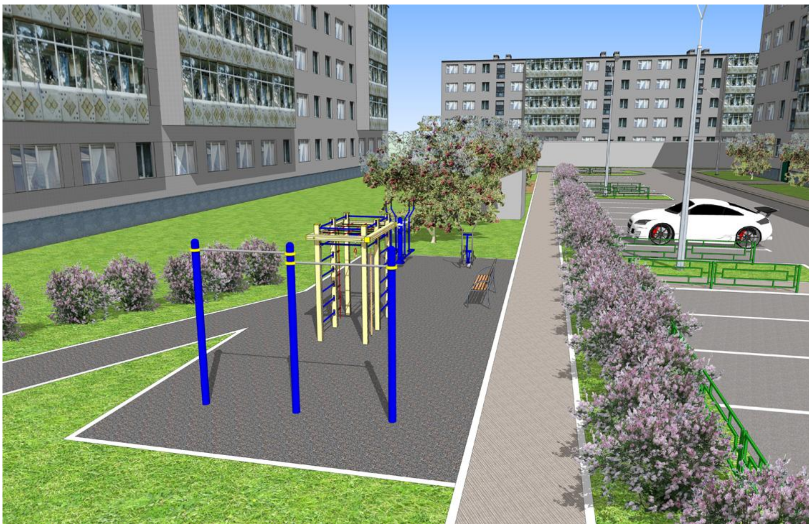
Перспективный вид с юго-западной стороны двора по ул. Юбилейная 5.