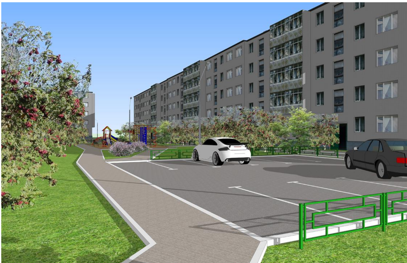
Перспективный вид с юго-западной стороны двора по ул. Юбилейная 3 .