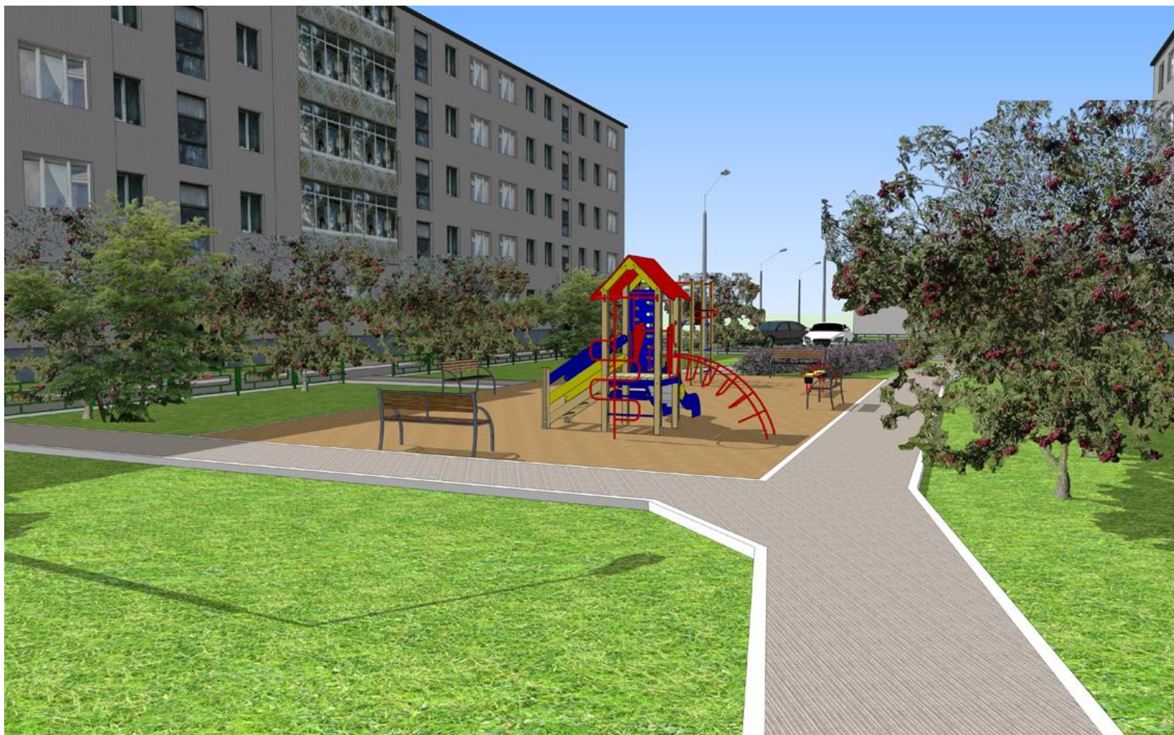
Перспективный вид на детскую площадку с северной стороны двора по ул. Юбилейная 3.