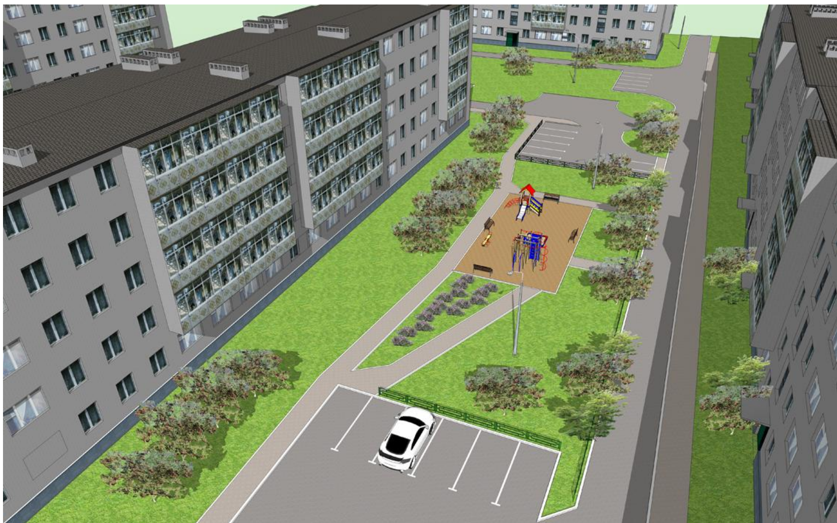
Перспективный вид на двор по ул. Юбилейная 3