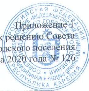
Схема границ территории для осуществления территориального общественного самоуправления на территории Пиндушского городского поселения

Приложение 1 к решению Совета Пиндушского городского поселения от 13 августа 2020 года № 126