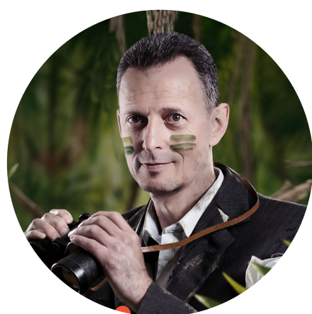
Александр Фридман Хаос-менеджмент