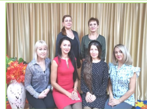
в воспитании детей в семье.