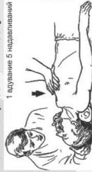
1 вдувание 5 надавливаний

Государственная инспекция по маломерным судам МЧС России по Иркутской области