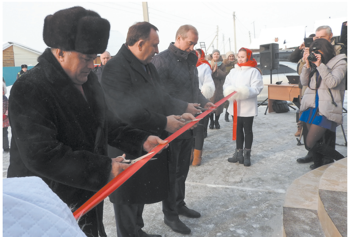
В деревне Талька 21 февраля был торжественно открыт Дом культуры.