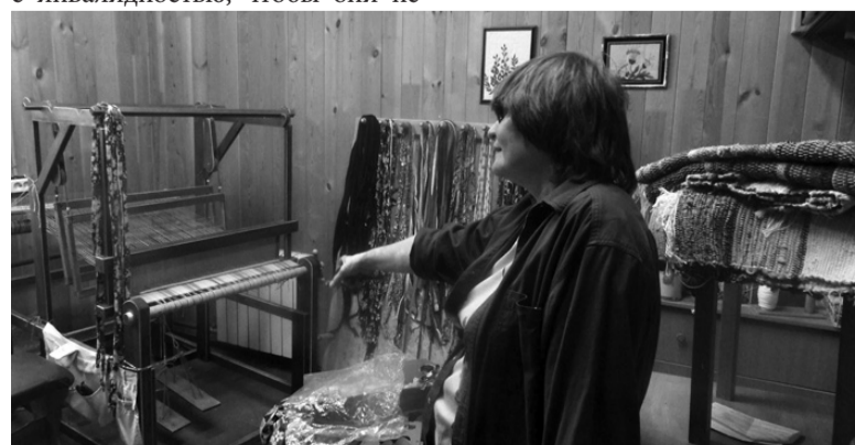
В ткацкой мастерской.