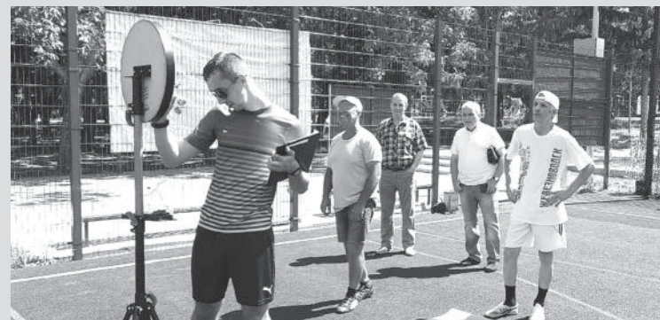
По материалам пресс-службы администрации Железноводска

Участники соревновались в дартсе, прыжках в длину с места и бросках в баскетбольное кольцо.