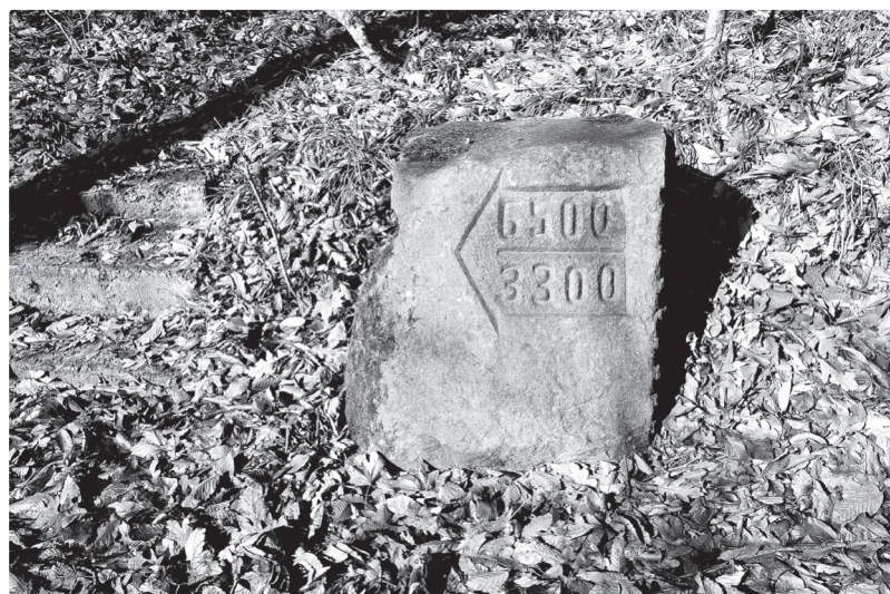
Администрация города-курорта Железноводска