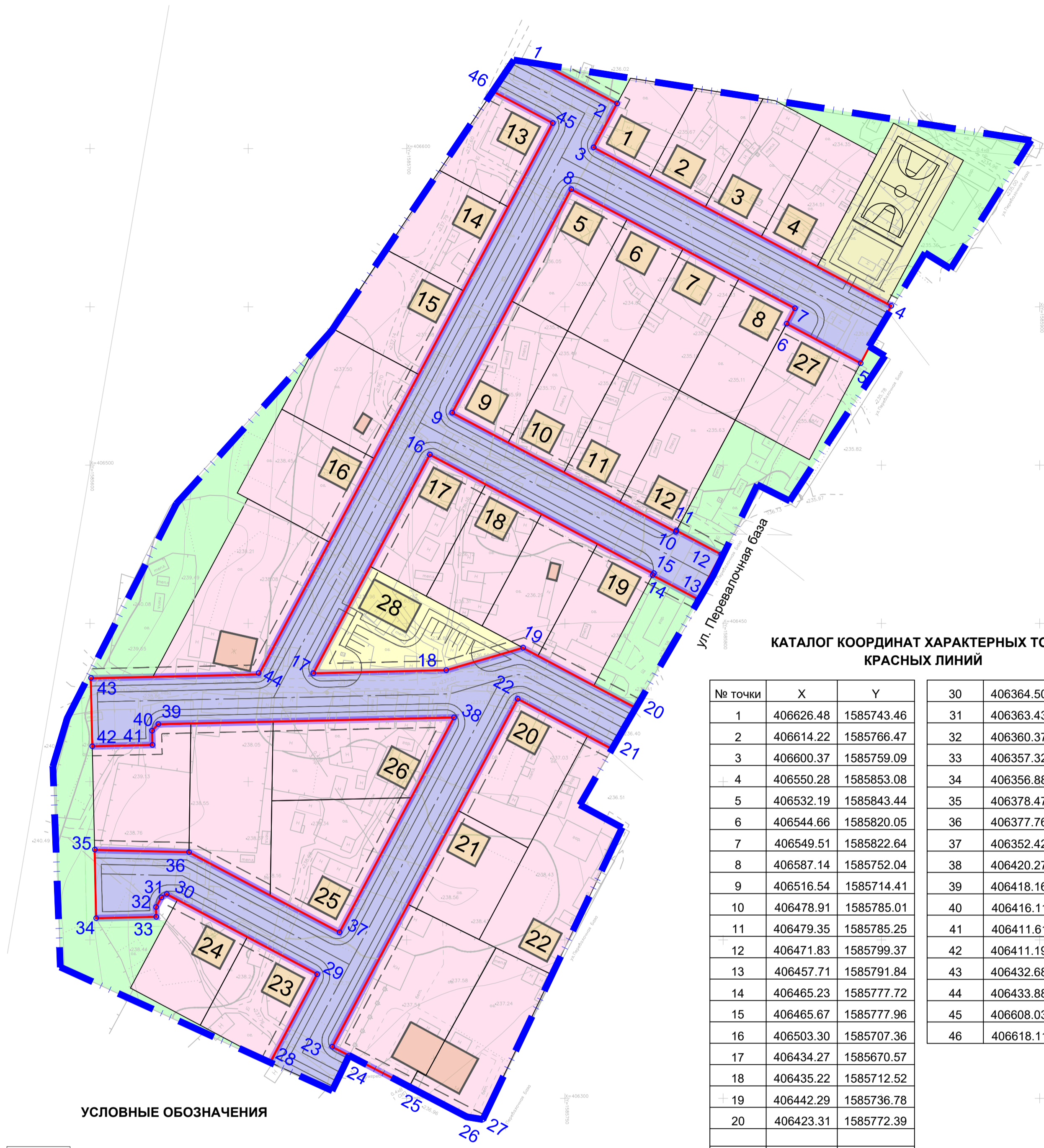
КАТАЛОГ КООРДИНАТ ХАРАКТЕРНЫХ ТОЧЕК КРАСНЫХ ЛИНИЙ