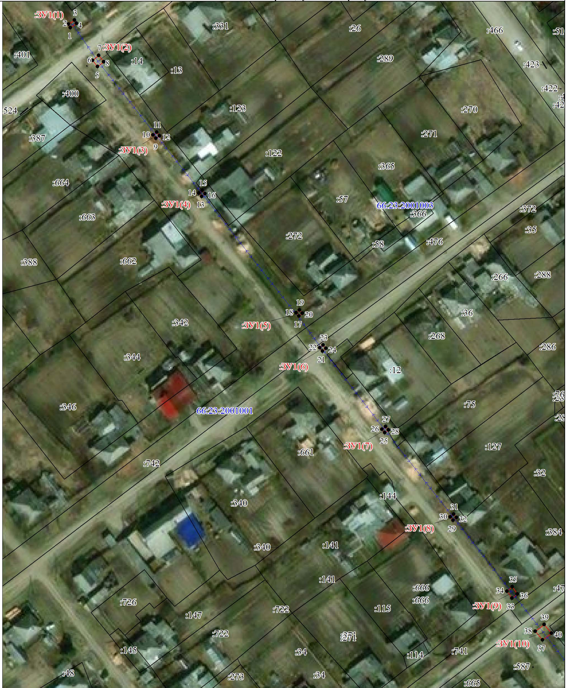
Схема местоположения границ публичного сервитута