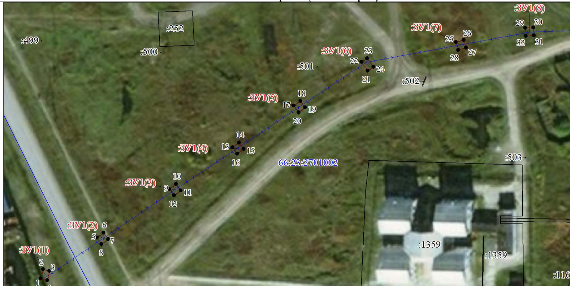
Схема местоположения границ публичного сервитута