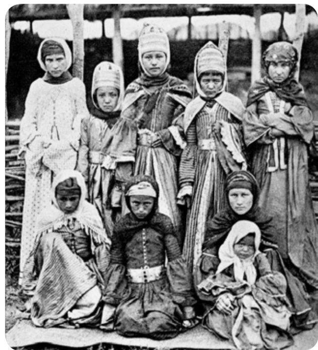
Ногайские девушки. Конец XIX века.