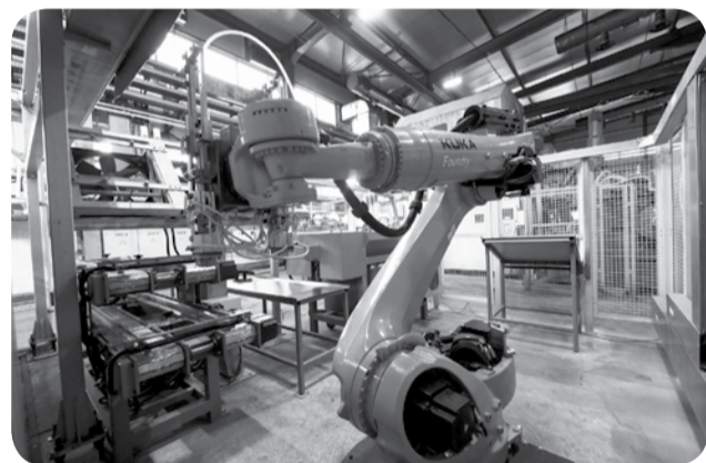
Новое оборудование на роботизированной производственной линии