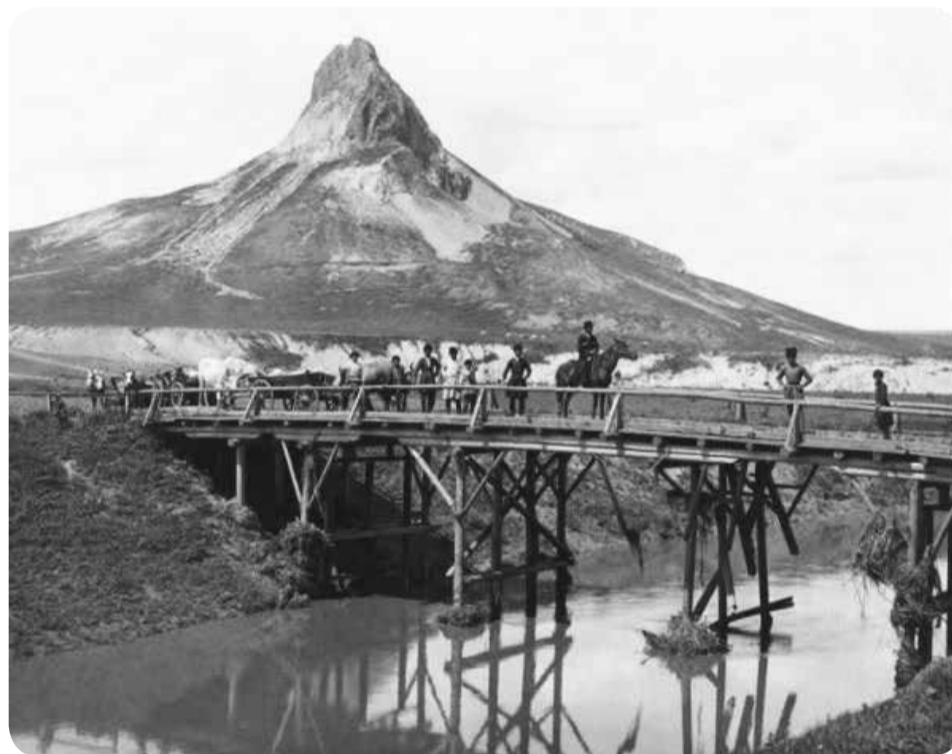
Гора Кинжал и мост через реку Суркуль. Вид со стороны аула Канглы, конец XIX века.

Этнотопонимы, частично отразившиеся на дореволюционных картах Кавказа, дают возможность проследить историю расселения, места кочевок, пути передвижения племен и родов ногайцев (найман, мангыт, канглы, керейт, карас, сейит, исун и др.) в степях и предгорных районах. На карте 1891 года, например, мы видим ногайские поселения Канглы, Кирейт, Карас, Найман, Ак-Мангыт, Мангыт, расположенные, как правило, вблизи рек, в степных районах, богатых