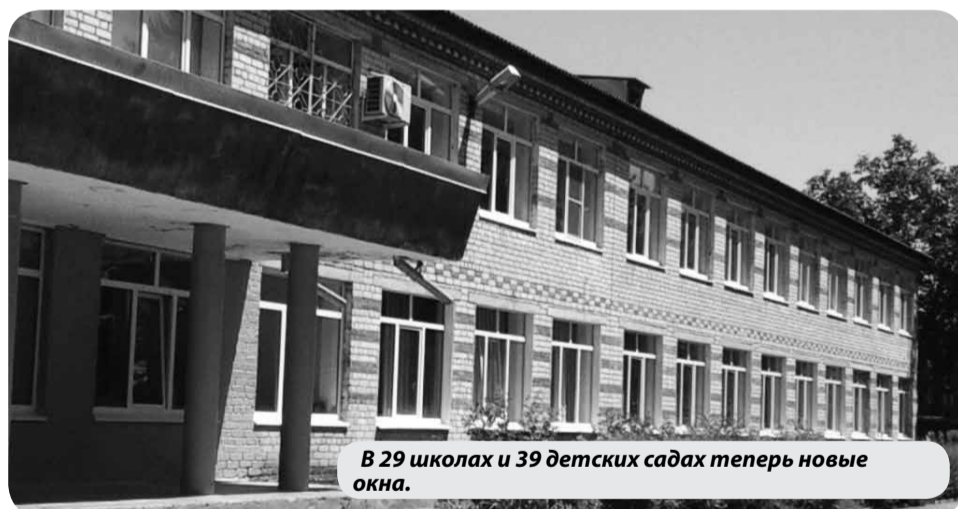
В 29 школах и 39 детских садах теперь новые окна.

В Минераловодском округе завершилась реализация госпрограммы по замене оконных блоков в дошкольных и общеобразовательных учреждениях