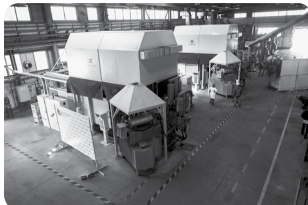
Новая линия завода по производству алюминиевых радиаторов в г. Невинномыске