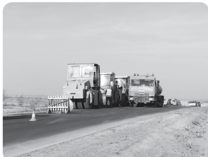
В регионе продолжается реализация нацпроекта «Безопасные и качественные автомобильные дороги».

Между тем, муниципалитеты региона уже на 96% завершили конкурсные процедуры по работам, запланированным в рамках нацпроекта на 2022 год.