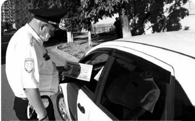
Сотрудники Госавтоинспекции раздают участникам дорожного движения памятки ПДД.

Пресечено 10 нарушений по части 1 статьи 12.29 КоАП РФ (Нарушение Правил дорожного движения пешеходом), три нарушения по части 3 статьи 12.23 КоАП РФ (Нарушение пра-