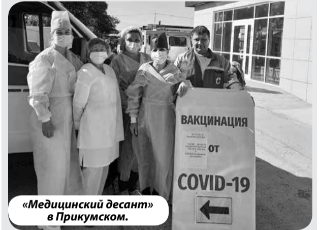
«Медицинский десант» в Прикумском.

В состав мобильной бригады вошли невролог, онколог, оториноларинголог и терапевт Минераловодской районной больницы, говорится в сообщении управления по информполитике аппарата Правительства СК.