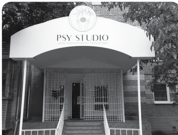
С начала года на средства соцконтракта были оборудованы маникюрные салоны, ателье, парикмахерская, пиццерия и другие предприятия.

В округе также активно заключаются социальные контракты по направлению «Осуществление предпринимательской деятельности (самозанятости)». С начала года на средства социального контракта были оборудованы и успешно заработали несколько маникюрных салонов, швейных ателье, парикмахерская, пиццерия, станция техобслуживания автомобилей, Центр психологической помощи, оказываются услуги по ремонту и отделке помещений и др.