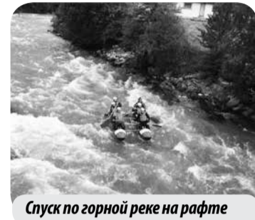
Спуск по горной реке на рафте