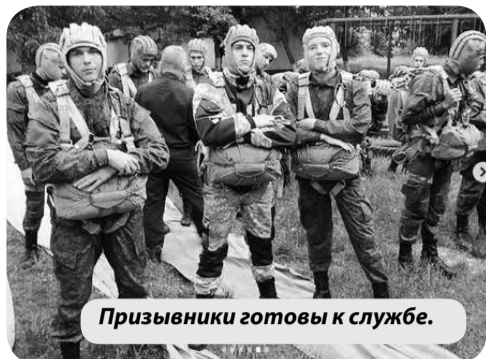
Призывники готовы к службе.

Несколько дней назад завершился весенний призыв -2021. В Минераловодской техшколе ДОСААФ России подготовлено 28 человек по программе военнослужащего ВДВ («Водитель-парашютист» ВУС-837Д).