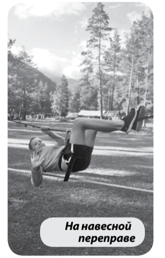
На навесной переправе