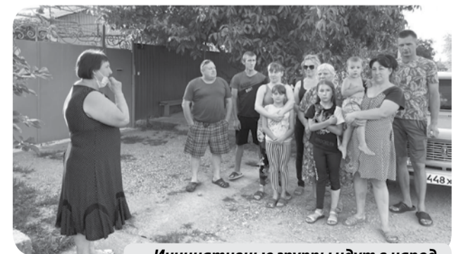
Инициативные группы идут в народ.

В рамках дальнейшей работы инициативные группы будут рассказывать и предлагать свои проекты