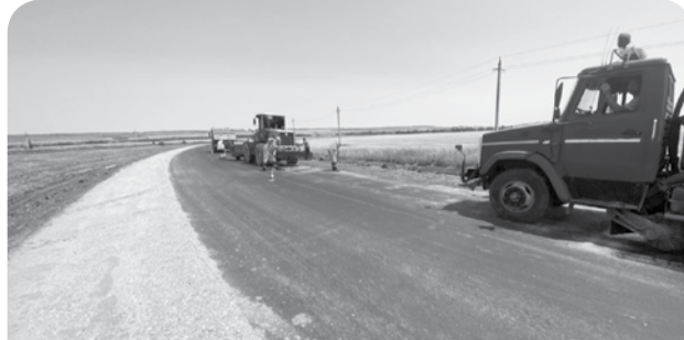
Региональная дорога М-29 «Кавказ»-Средний-Новокавказский – важная транспортная артерия, которая соединяет нескольких округов.

Напомним, Губернатор края отмечал, что за последнее время дорожниками