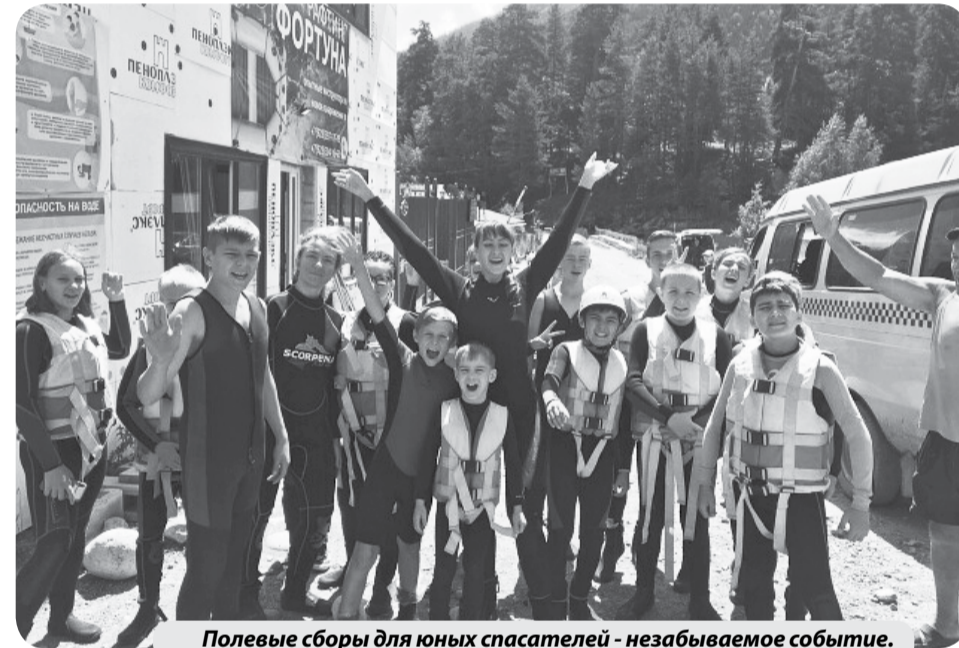
Полевые сборы для юных спасателей - незабываемое событие.

Юные спасатели из Минеральных Вод в течение 10 дней не только активно отдохнули в одном из красивейших мест Кавказа, но и проверили свои силы, пройдя испытания в походах и сплаве по горным рекам.