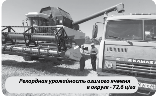
Рекордная урожайность озимого ячменя в округе - 72,6 ц/га

Лидирует по урожайности АО «ТПКЗ № 169»: озимый ячмень - 72,6 ц/га, озимая пшеница - 52,6 ц/га, горох - 33,5 ц/га. Сельхозпредприятия и фермеры округа активно ведут сопутствующие работы: лушение стерни, подъем полупара.