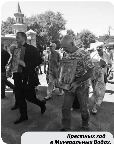
Крестных ход в Минеральных Водах. Фото Елены Христовой.

По материалам Инстаграм-аккаунта @arhivmw