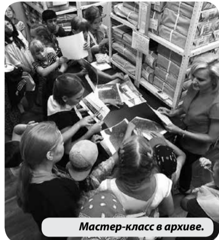
Мастер-класс в архиве.

Сотрудники архива подготовили для ребят наглядную беседу-презентацию по отделе, рассказали о семейных документах и провели мастер-класс «Я и моя родословная».