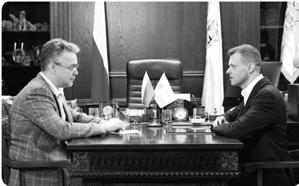
Со ставропольскими IT-специалистами планируют разрабатывать системы цифрового прогнозирования природных ЧС.

– Несколько лет назад мы начинали с устранения цифрового неравенства. Сегодня широкополосный интернет есть в большинстве населённых пунктов края. Реализуется проект по внедрению технологий «умного города» в городе-курорте Железноводске. Цифровизация приходит в образование, получает распространение телемедицина. И мы заинтересованы быстрее развиваться в этих направлениях. Рассчитываю, что партнёрство с РАЭК поможет краю войти в число базовых регионов при внедрении новых цифровых технологий в стране, – обратился глава региона к директору РАЭК.