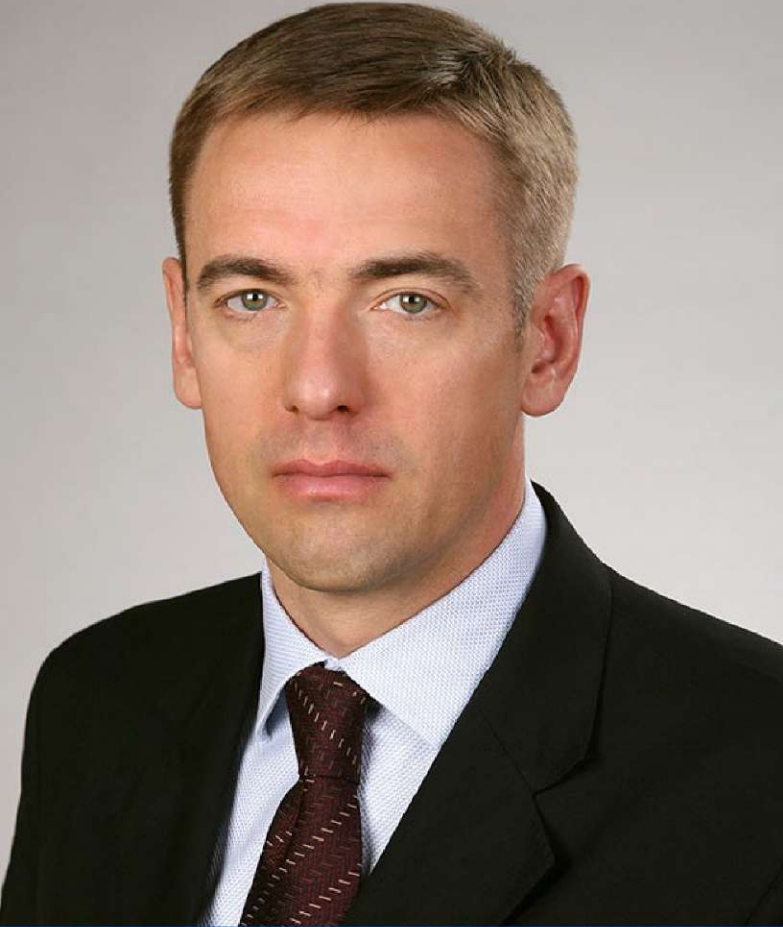
В.Л. Евтухов – статс-секретарь – заместитель Министра промышленности и торговли Российской Федерации