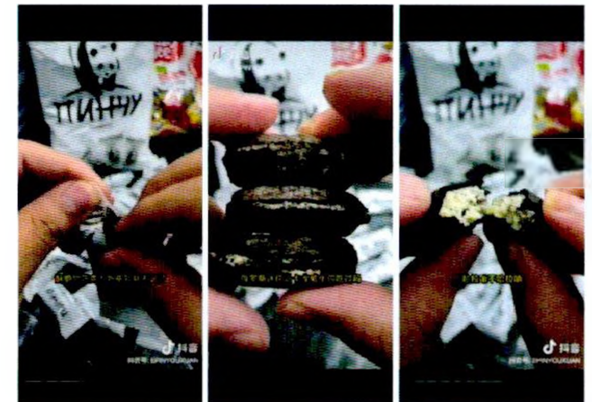
Видео в TikTok