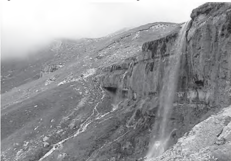
-УчIан ччай, учIан хьанай акъаявхха, зул оьрму лахьи бивуй,-тIий ия мугу.