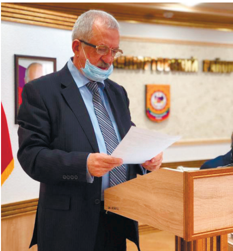
Окончание. Начало на стр. 1

«Если наши граждане не хотят верить и принимать факт наличия коронавирусной инфекции и отказываются соблюдать рекомендованные меры самоизоляции, то диалог с ними необходимо вести на языке закона,