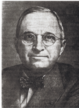
Президент США Г. Труман.