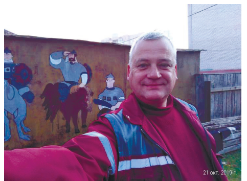
Вы раздавали смерть без сдачи.

Помощь не заставила себя долго ждать и уже сегодня к зданию администрации подъехала машина сети клиник «Медицина», груженная общими средствами индивидуальной защиты.