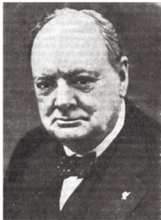
Премьер-министр Великобритании У. Черчилль.