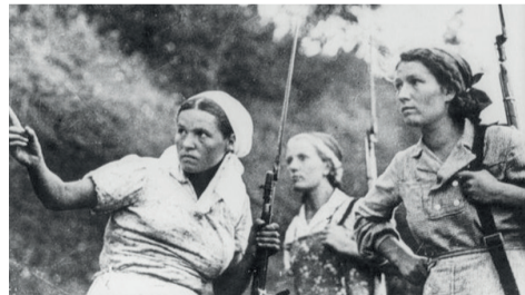
Женщины на войне

Представьте себе, 80 тысяч офицеров красных армий Великой Отечественной войны были женщинами. В целом в разные периоды военных действий на фронте было от 0,6 до 1 миллиона женщин. Из представителей слабого пола, добровольно вышедших на фронт, были сформированы: стрелковая бригада, 3 авиационных полка и резервный стрелковый полк. Кроме того, была организована женская школа снайперов, дети которой не раз входили в историю советских военных достижений. Также была организована отдельная компания женщин-моряков.