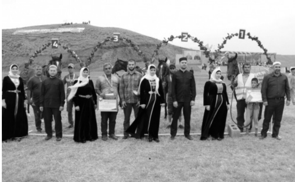
Окончание. Начало на стр. 2

В рамках праздника состоялись скачки в честь муфтия РД, шейха Ахмада Афанди. Мероприятие почтил своим присутствием шейх Ахмад Афанди.