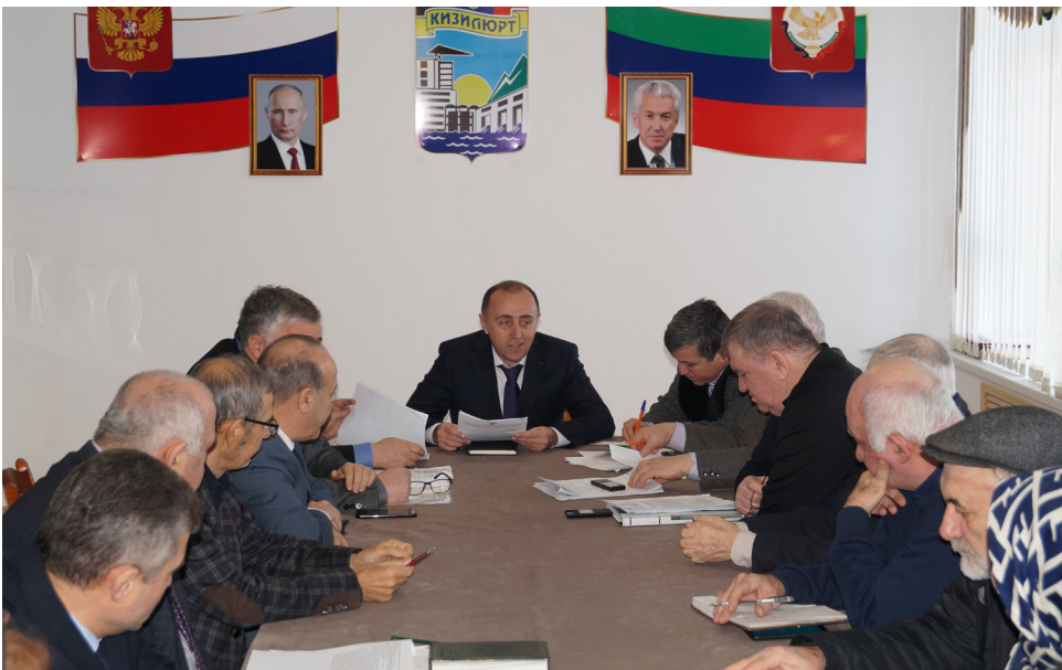
Окончание. Начало на стр.1

По информации представителей газовой службы, мэр города поручил Госжилинспекции совместно с УК в течение рабочей недели установить количество установленного газового отопительного оборудования в жилых многоквартирных домах, провести рейдовые