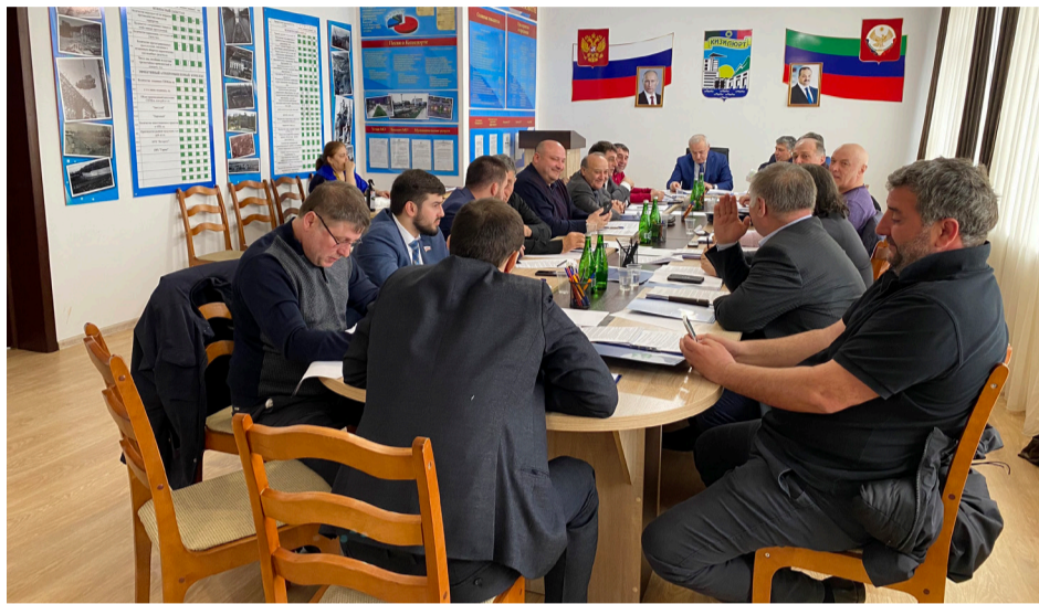
Вчера, 31 марта, в малом зале администрации городского округа «город Кизилюрт» состоялась очередная двадцать шестая сессия Собрания депутатов городского округа «город