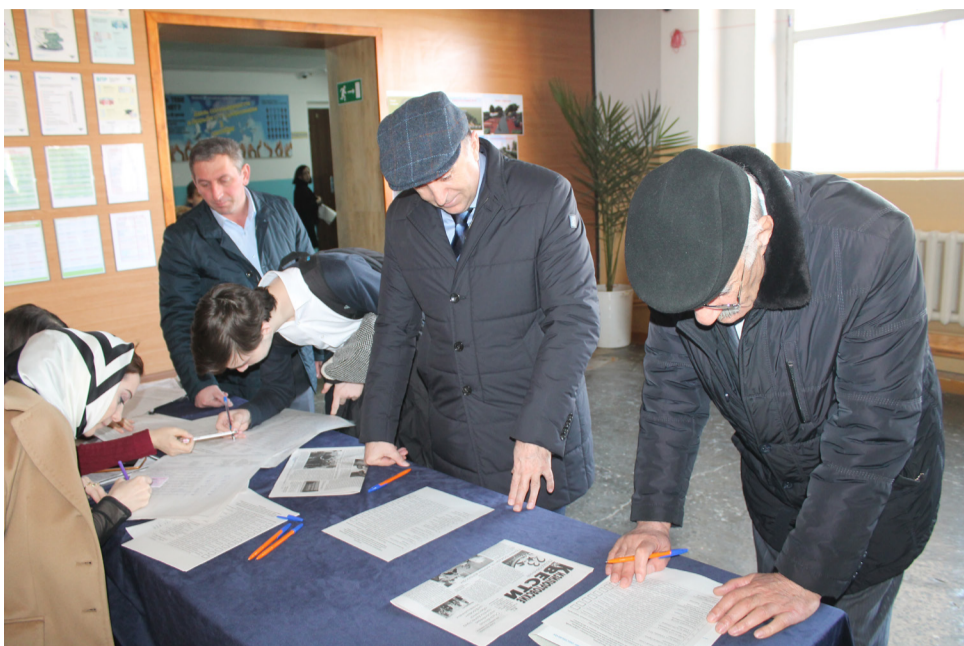
Как уже сообщалось ранее, в нашем городе продолжается реализация муниципальной программы «Формирование современной городской среды в городском округе «Город