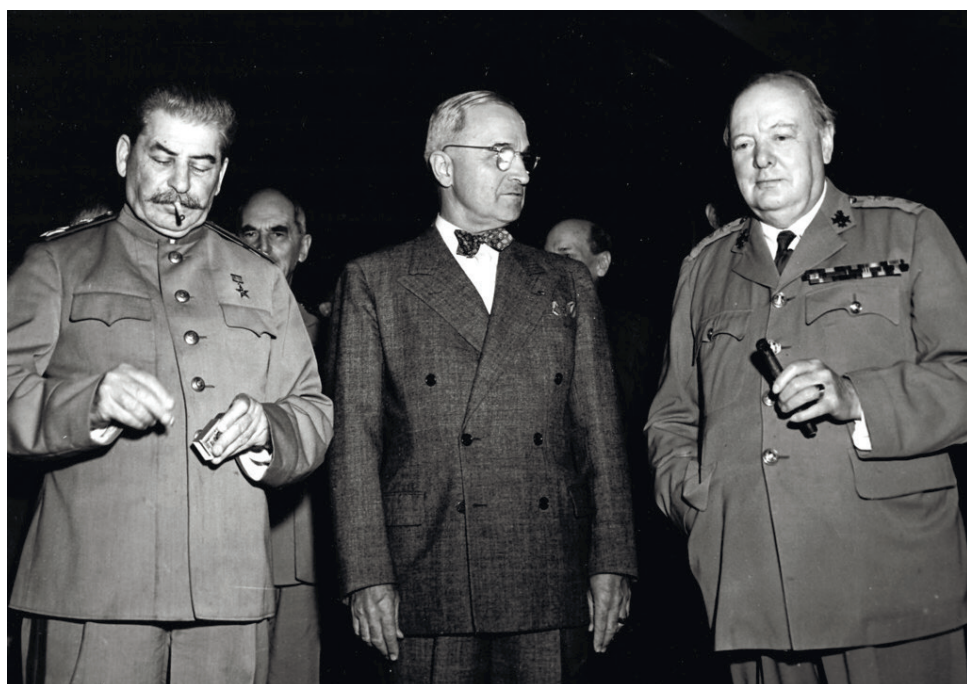
Трумэн (в центре) и Черчилль (справа) собирались в Потсдаме ошарашить Сталина новостью о ядерной бомбе. Но, как видно на фото, генсек остался невозмутимым.

Железнодорожная колея от границы СССР до Потсдама была «перешита» по советскому стандарту (шире). Для путешествия