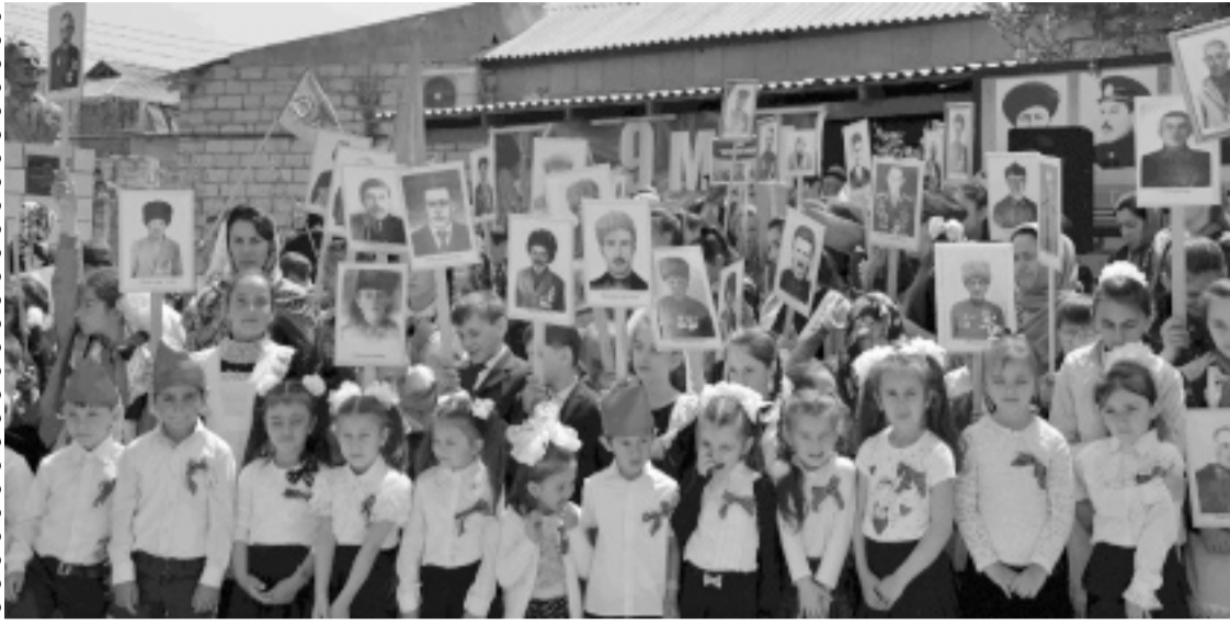
Суратлизиб: Мухела шилизиб Чедибдешла Бархила байрам.

Мухела шилизиб дахьал дусмазиб гяхлси гядатли бетаурли саби Чедибдешла байрам бахьал халкьла бутлакьяндешличил дурабуркни. Шила администрация, С. Кьурбанова училилси агрофирма, багьудила, культурала, медицинала учреждениеби, шила хьунул адамтала Совет-лебилра цабиубли хядурбируси ил байрам гьачам чебаибсини хьумхлертесили бетарули бирар.