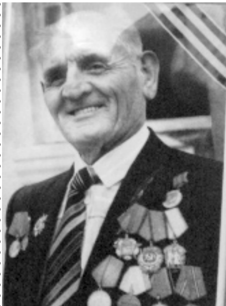
Суратлизиб: М. МяхлЯмадгялиев.

Майла 7-личиб Ахьушала районна краеведческий музейлизиб МяхлЯмадгялиев МяхлЯмад ГябдулхлЯлимовичла гьамтачил гьунибаьни бетерхур.