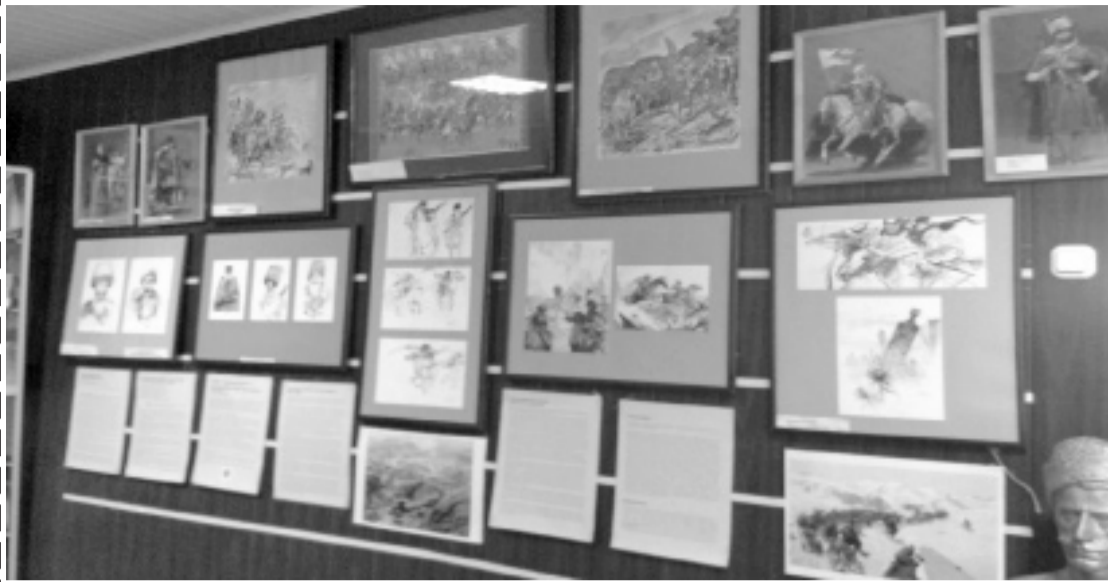
Суратлизиб: выставкала ца бутла.

Апрельла 30-чиб Ахъушала районна краеведческий музейлизиб «Архив Ахульго» биклуси выставка абхъиб. Ил выставка хасбарилри 19-ибил даршудуслизир Кавказлизиб детерхурти дьвгас.