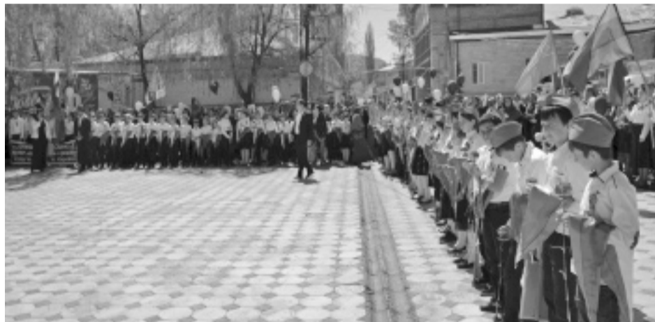
На снимке: участники торжества в честь Дня Победы в с. Акуша.

В память о тех, кто не вернулся с войны, была объявлена минута молчания и выпущены в небо более сотни воздушных шаров. Затем группа учащихся 5-х классов Акушинской СОШ №1 была принята в ряды детской организации «Наследники Победы».