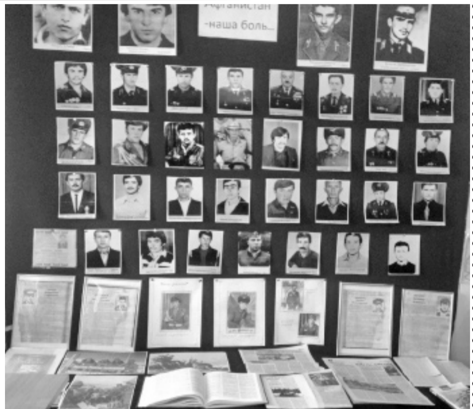
Суратлизиб: Афганистаннизирад дявтала бутІакъянчибас хасбарибси стенд.