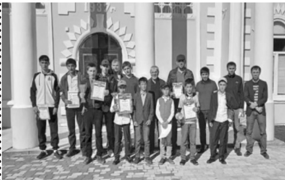
Суратлизиб: ДЮСШ-ла тренерти ва гъалабикити дурхІни.