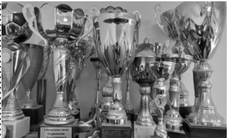
Суратлизиб: дурхІнани абзаначир касибти кубокуни.

меранира далкъаахъурти сари. Отоплениера сагали барахъибси саби. Спортла гІягІниахъала, борцовский къалтин сагали хибти сари. Гъанна иша башути дурхІнас ва бузути тренергас дегІлара гІяхІти шуртІри лер.