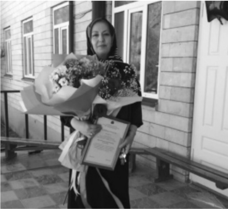
Суратлизи: Р. Арслангялиева.