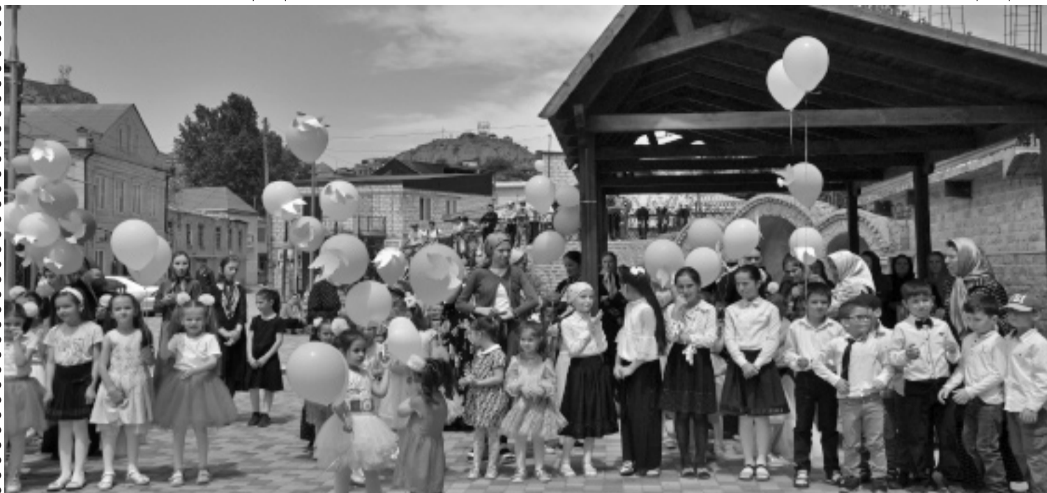
На снимке: праздник для детей на площади сел. Акуша.

1 июня более 200 детей Акушинского района приняли участие в праздничном мероприятии, посвященном Дню защиты детей.