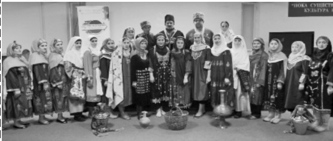
Суратлизиб: Ахъушала районна фольклорла ансамбльла бутлакьянчиби.

Ахъушала районна культурала хянчизарти дахъал дусмазиб машгурти саби чула пагмуртачил, халкьани ургарти, Россияла духнарти балбуцуназир бутлакьяндеш дирниличил. Илдани касибти дипломти, грамотаби, баркаллала кагурти цаладяхъялли гяхлил халаси выставка барес вирар. Чули гямрулизиб чебиклибси санигъатлис марли, сегъуна - дигара заманализиб, яни биаб, дуцрум диаб, иличи херхлебиклули, гъйичи дурабухъес ва чула пагмур-