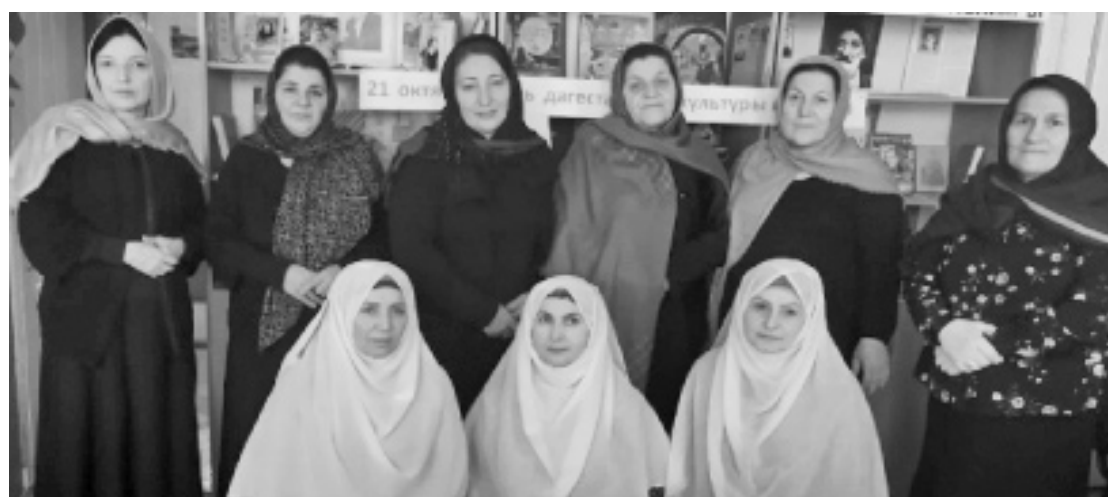
Суратлизиб: ЦБС-ла хянчизарти библиотекализиб бетурхуси балбуцличиб.

Чебяхлиси Чедибдешла бархли «Бессмертный полк» биклуси балбуцлизирра бутлакьяндеш дарра. Россияла ва дурала улкнала поэтунала,