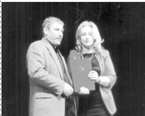
Суратлизиб: З. Бутаевани ХІурматла грамота бедлуғули.

Биклули бирар, хІурмат сархесличибра ил бихІес кыянси саби или. Ахъушала шилизив аклубси ва халаваибси, гІергъити 35 дус МяхІячкълализив хІеририси ва узуси Маллаев МяхІяммадличила биалли я шилизиб, я шагъарлизиб чилилра вайси гъай бурес хІейрар.