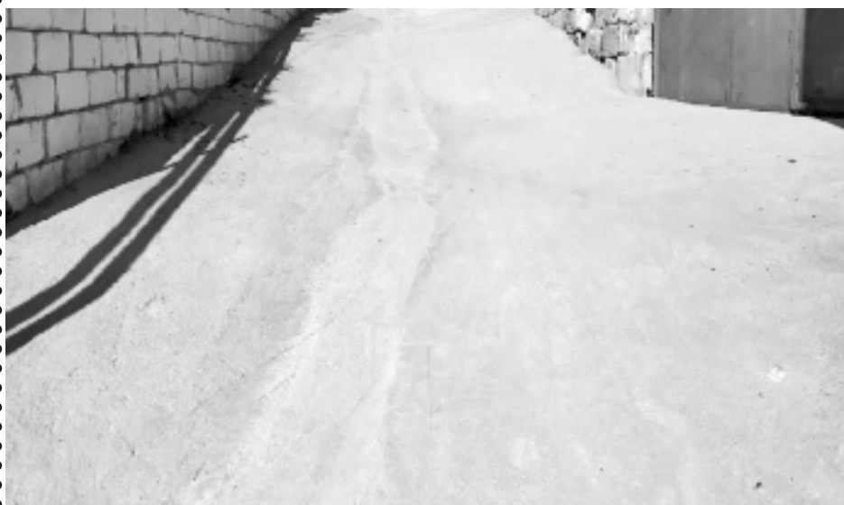
Суратлизиб: Ахъушала шилизисси сагабарисси къакъа.

ИшбархІи школала директорла хІянчи дегІлара жавабкартазибад ца саби викІаллира къяна бетхІерар: челис-че цІакъдикІули сари багъуди кайсахъниличи гІалабуни, дурхІнас биалли бахъалгъунтас бучІес дигули ахІен, белчІудиличи иштхІ адикъес бажарбикесли бузес гІягІнили саби учительти, учительталара декІар-декІарти масъулти камдирули хІедийни сабабли директорлис ил масъалаличилара гъар бархІи пикриикІес чевкъу-