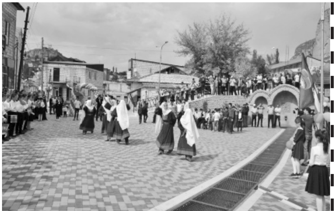
На снимке: открытие площади--радость для всех.