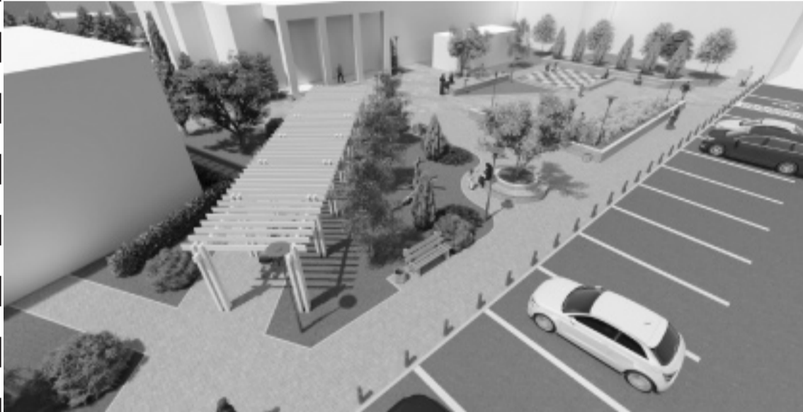
Суратуназиб: районна администрацияла юртла гьалар дурадурк'луги х'янчила проектуну.