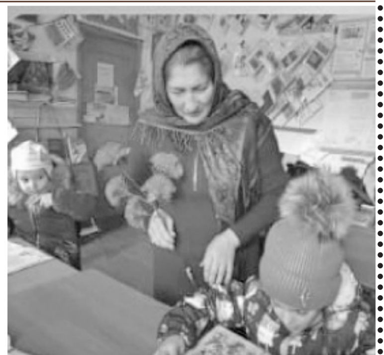
Суратлизиб: Бутрилла шила библиотекализиб шадлихь.

Нешла Бархилис хасдарибти шадлихьуни районна лерилра шимазир детерхур. С.Гябдуллаева, нушала корр.