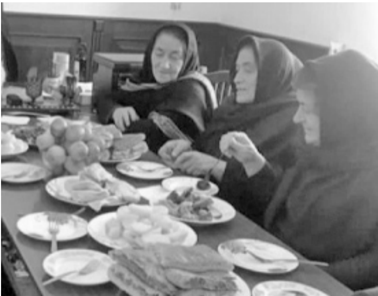
Суратлизиб: МухIела шила администрациялизиб шадлихь.

Ахъшала районна шимазибти библиотекабазир, культурала Юртаназир, шимала администрациябачил ва школабачил дархдасахьи, дахьал шадлихьуни детерхур Нешла Бархила байрамлис хасдарибти.