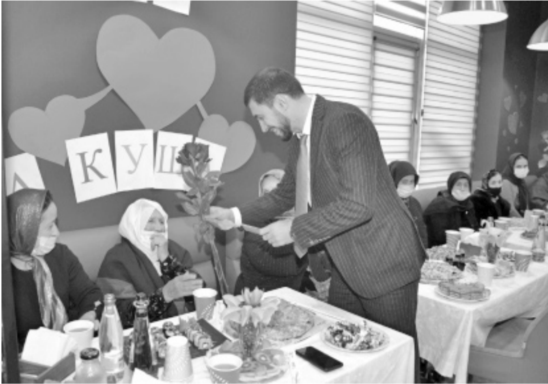
Суратлизиб: Мяхляч Гябдулкаримовли нешани мубаракбирули.

Ноябрьла 29-личиб дурбуркүси нешла Бархила хурматлис ноябрьла 26-личиб районна шимазибад жибабит хьунул адамтачил, нешанабил гьунибаъни бетаур.