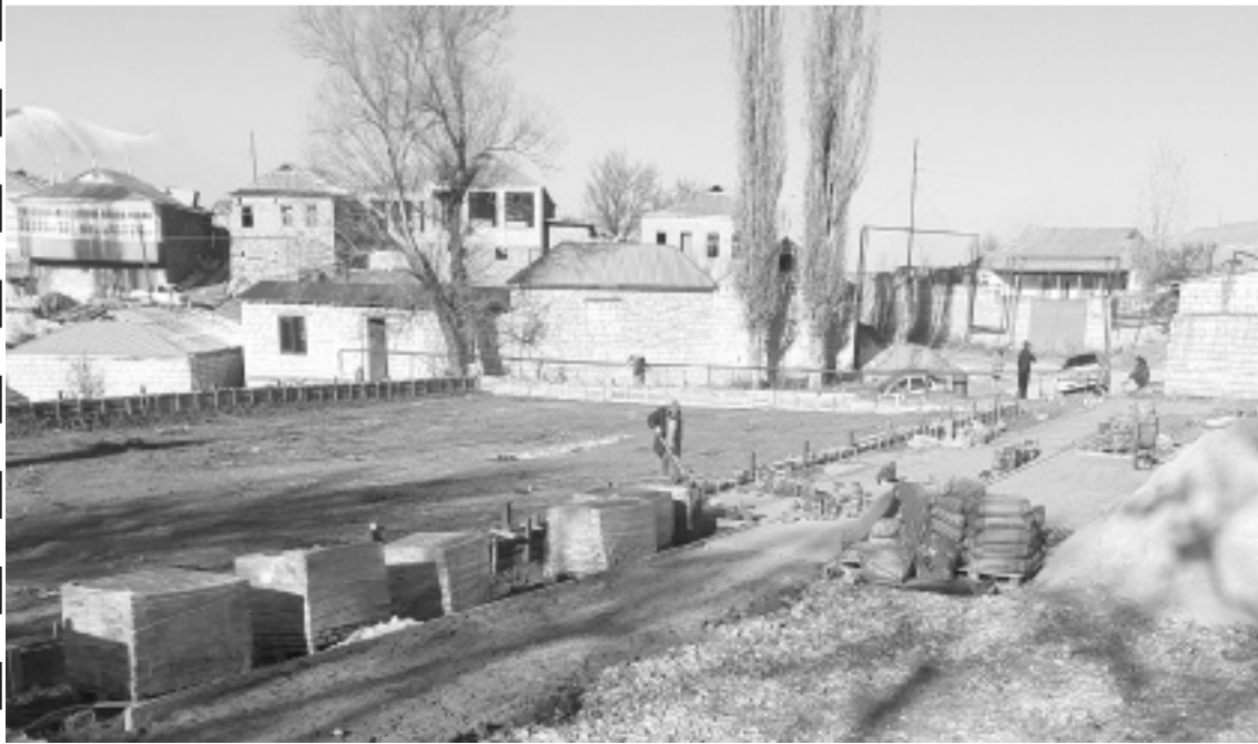
Суратлизиб: Бурх'имьякъмах'ила шилизиб спортплощадка бируйх'ир х'янчи детурхули.

Ах'ушала шилизир г'ерг'иси заманала дух'нар дах'ял г'ях'лти х'янчи дурадурк'луги сари. Бусаг'ят детурхути х'янчи лер районна администрацияла юртла г'яларти мер-мусаличир ва спортзаллизир.