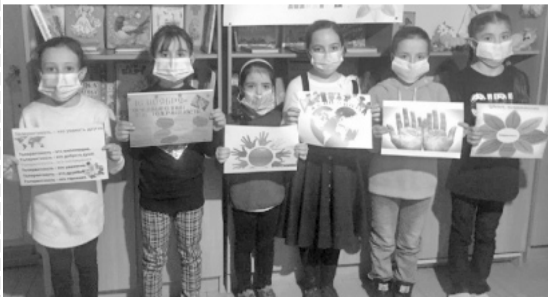
На снимке: учащиеся начальных классов на мероприятии в библиотеке.

В районной библиотеке состоялось мероприятие, посвященное этой дате.