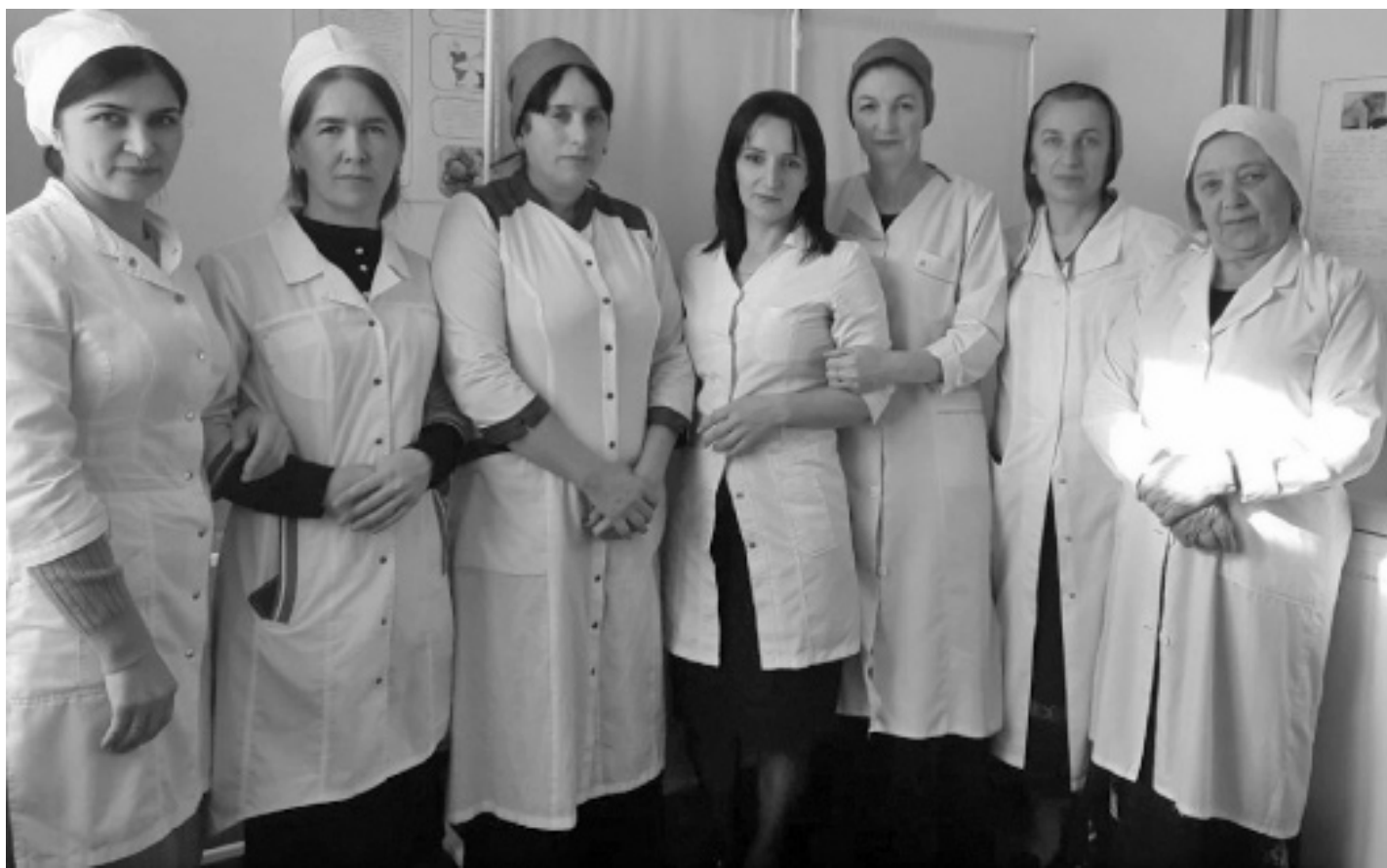
Суратлизиб: МухIела шила амбулаторияла хIянчизарти.

МухIела шилизибад районна центрлизи гъар бархIи бузес башути ГIяхIцад адамти леб—