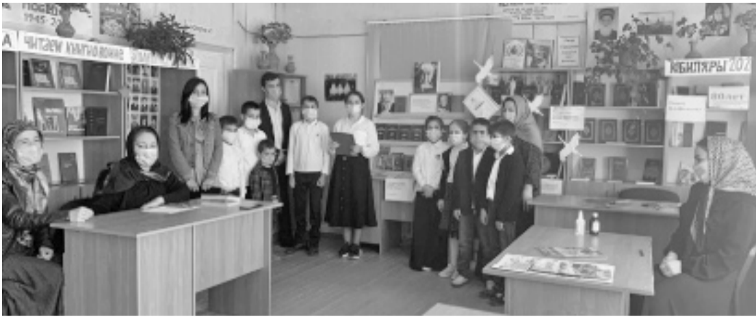
Суратлизиб: районна библиотекализиб балбуц бетурхули.

Ахъушала районна библиотекабазир сентябрь базлизир лебилра дунъяличив машгурси поэт Расул Хиямзатов аклубхейчивад 97дус дикнилис хасдарибти балбуцуни детурхар.