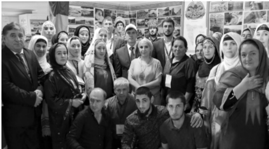
Суратлизиб: Ахъушала районнизибадти форумла бут'акъянчиби.

Октябрьла 16-19-ибти бурх'назиб Мях'якъалализиб «Россия--моя история» бик'луси комплекслизиб туризм т'инт'бик'лахънилизиб хасбарибси форум бетерхур.