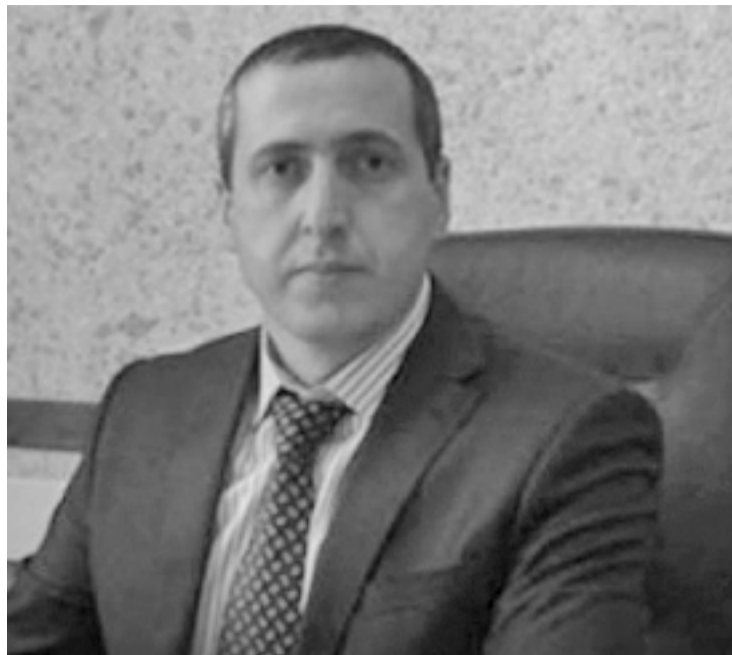
Суратлизив: ГI. БяхIяндов ва Россияла Федеральное казначействолу бедибси ХIурматла грамота.

«ХIялалдиаб ГIябдуллагълис! Финансунала управлениелизирад арц иша дакIалли, камсилра къанхIедиахъубли нушачи даахъес къайгъназив виар. Ил секIал тIалаб-