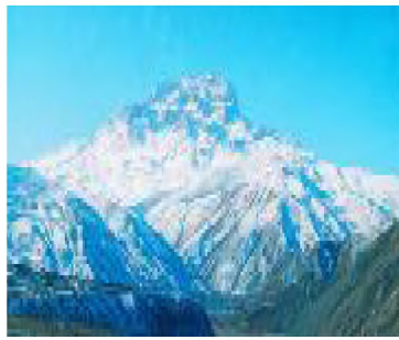
Газет 2001-йисан ноябрдилаы акъатзава

РД-дин Докъузпара райондин общественно-политический газет. Общественно-политическая газета Докузпаринского района РД.