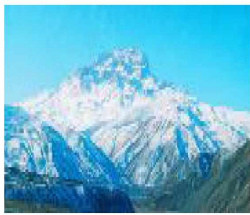
Газет 2001-йисан ноябрдилаы акъатзава