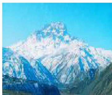
Газет 2001-йисан ноябрдилаы акъатзава

РД-дин Докъузпара райондин общественно-политический газет. Общественно-политическая газета Докузпаринского района РД.