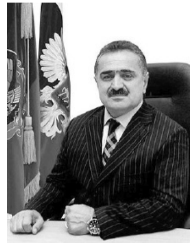
раб клудияб ками.

Хлажи Махлэчев глумруялдаса ватгалъун ана шуго соналдаса цикклараб заман. Гьеб буго нилъее кка-