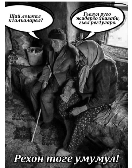
Рехон тоге умумул!

Гъединал, ц1алдолезул рек1елъе рортулел, щивав чи кант1изавулел, пикру гъабизе т1амулел раг1аби руго маг1арулазул шаг1ир Пайшат Малачиевалъул цо коч1олъ. Х1исаб гъабураб мехаль гъединги гъеч1ищха? Рукъоб къварилъи рек1елъ ургъелги камурав чи вук1унаро. Хасго херлъарал г1адамазул. Инсанасул г1умру буго г1олеб, беч1алеб, холеб т1егъ-хералда релълъараб, гъава-бакъалда рекъон бук1ун бже. Херлъи бач1уна изну ц1ехч1ого, жиндирго хасияталгун, халатаб ч1амуч1лгун, г1орхъи гъеч1еб ч1алг1енгун ва г1емерал г1узрабигун.